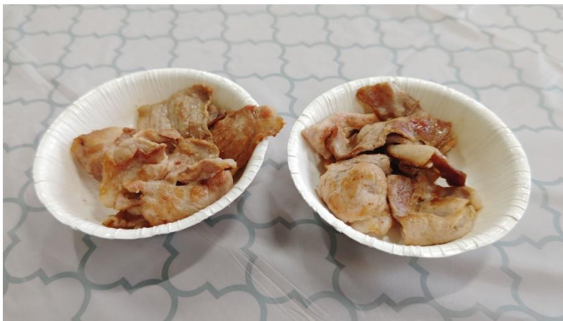
(写真：秋輝祭・販売された焼肉（豚）)