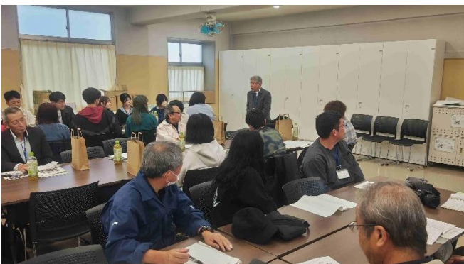
（写真：内田副会長によるご挨拶）