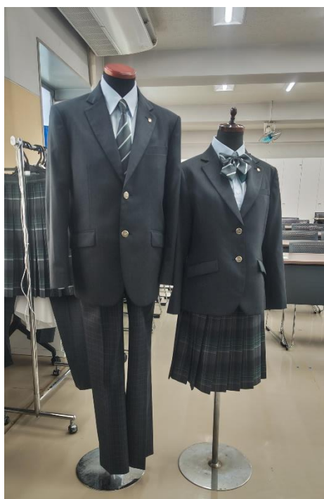
(写真：会場に飾られた※新制服)