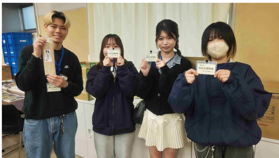
(写真：総会に出席した代議員および卒業生)