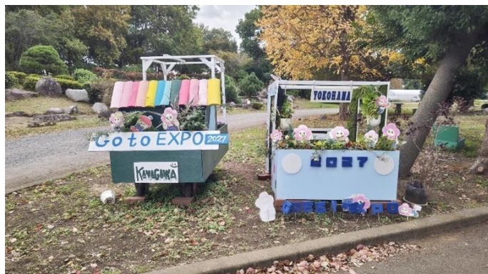
(写真：園芸博（2027年開催）の紹介ブース)