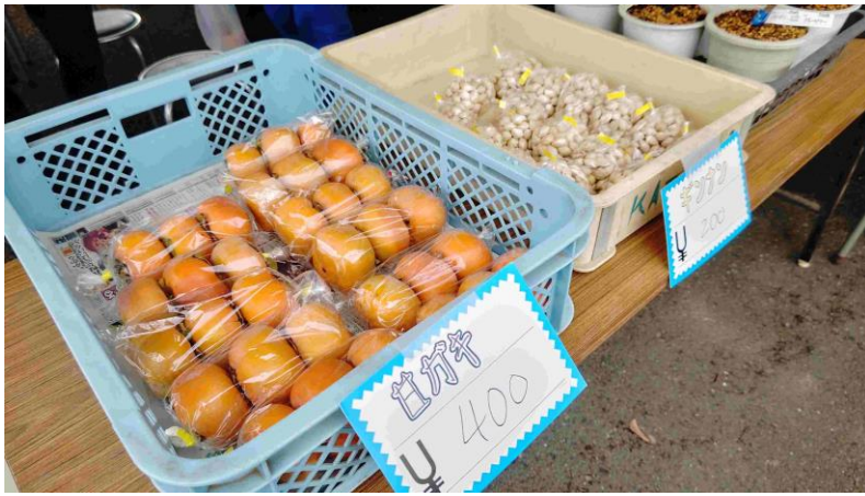
(写真：秋輝祭・果樹部ブースの様子)