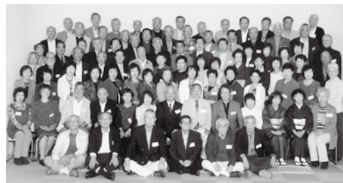
東商 17期 古稀 仲間の会 平成28年10月23日 於:ピュアリティまきび

ルを贈り喜んで頂きました。2次会も盛況裏に終わり「楽しかったよ、今度はいつ？」の声を後に散会となりました。