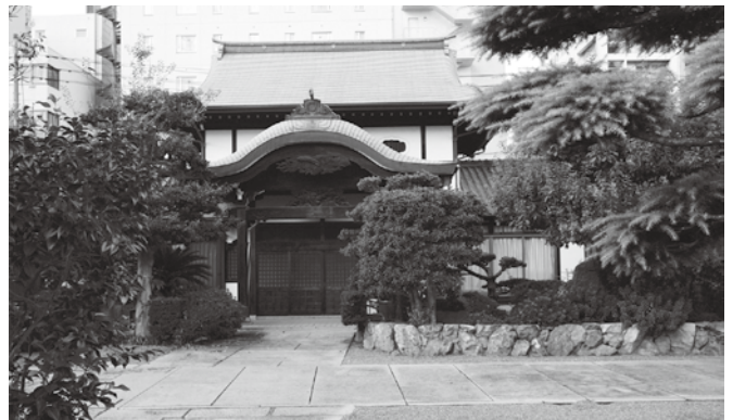
北区磨屋町にある岡山寺

舎が全焼し、古い貴重な資料の多くは失われていることが悔やまれます。この原稿を書いている11月までの6か月間で翠光会本部総会、各支部、事業者部会へも顔を出す機会がありました。一瞬のうちに打ち解けあい、仲間に引き入れながら語り合う、現在の役職は関係なく“期”を大切にしている関係こそ長年にわたり東商が続いてきた歴史なのだと感心しました。歴史を築き次世代へとつなぐ同窓会の皆さん、今後ともどうかよろしくお願いたします。写真は、市内電車柳川電停から南へ一本入ったところに今もある岡山寺を訪れた時に撮りました。岡山東商業高校の歴史はここから「岡山県商業学校」としてはじまりました。