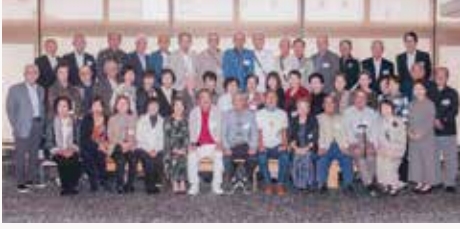
令和7年10月19日 於：ピュアリティまきび

母校を卒業して「60周年」の節目に皆で元気に集まり旧交を温めました！現役：吹奏楽部の応援参加をしてもらいマツケンサンバ・校歌など生演奏を目前で聞いて感動しました！また、昔の拡大写真も張り出して若かりし日の話で大いに盛り上がりました！