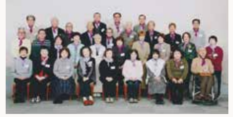
令和7年11月29日 於：ピュアリティまきび

70歳を迎えましたが先輩方々に言わせると「まだまだ鼻たれ小僧！」人並みに身体には、あちこちにガタが来ますが次の峠を目指して健康管理には十分に気を付けて行きましょう！と懐かしの校歌を大声で歌いあげて「喜寿再会」を合言葉に元気よく解散しました！